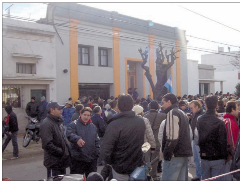
Zárate: Piquete de trabajadores químicos en la puerta de la delegación del Ministerio de Trabajo.

En Carbochlor fue a provocar la policía. Escupieron en la olla de los huelguistas, llevaron detenidos a la fiscalía a 18 compañeros. En Ipesa, matones con armas largas se dieron la tarea de hostigar al piquete. La comisaría 1° de Zárate se negó a tomar las denuncias de los compañeros. Sólo lo hizo cuando una movilización se estableció frente a la comisaría con la decisión de no retirarse hasta que se hubiera cumplido el trámite. Dos colectivos de la policía "custodian" Monsanto. Valga esto como enseñanza del