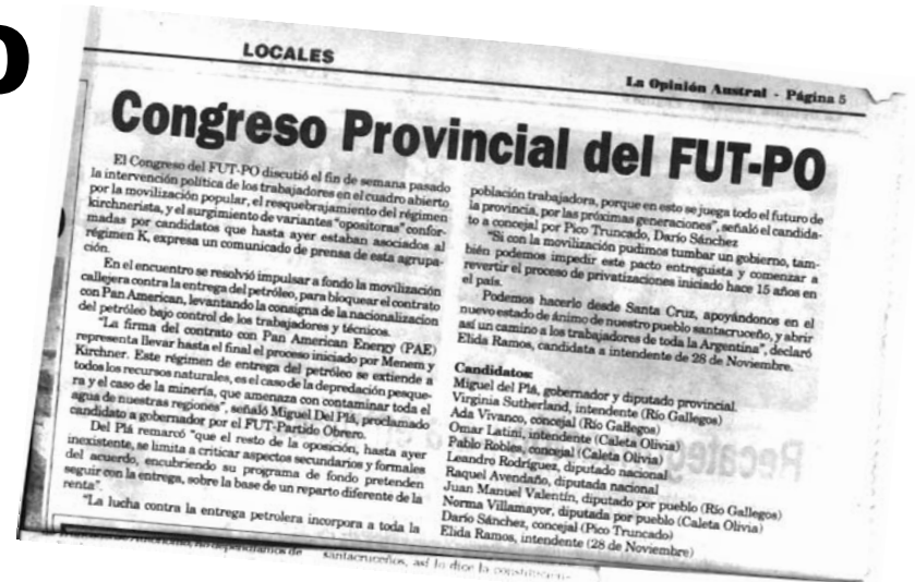
Repercusiones del Congreso del FUT-PO en la prensa de Santa Cruz.