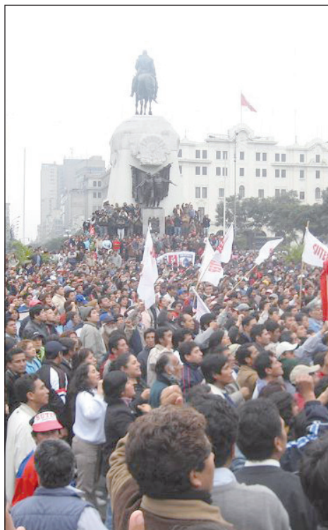
Manifestación docente en las calles de Lima.

Algunos comentaristas, como Jorge Castro, califican la huelga como "insurreccional" para desprestigiarla ( Perfil , 15/6). Frente a los "insurrectos", enfatizan el "dinamismo" de la economía peruana bajo Alan García. Destacan el crecimiento del producto bruto (7,5 por ciento en el primer trimestre), el extendido ciclo de crecimiento ("72 meses consecutivos, el