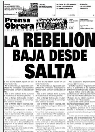
Prensa Obrera N° 825, 13 de noviembre de 2003

tividad de Mosconi y Vespucio, con una colocación de 120 ejemplares (donde había un promedio de 40 por semana).